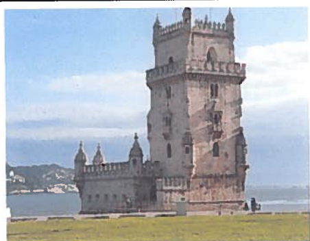
La tour de Belem

. Le pays limitrophe du Portugal est l'Espagne.