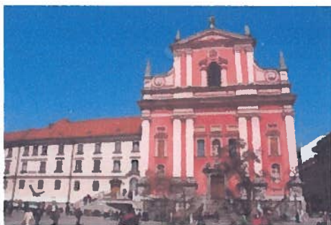
L'église franciscaine de Ljubljana

Etat d'Europe central, situé dans la péninsule des Balkans, la Slovénie est limitée au nord par l'Autriche et la Hongrie, à l'est et au sud par la Croatie, au sud-ouest par la mer Adriatique et à l'ouest par l'Italie.