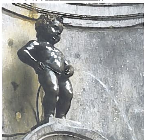
Le Manneken Pis