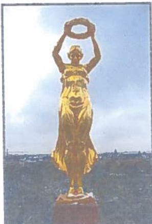
Le monument du souvenir

Le plat traditionnel du Luxembourg est le Bouneschlupp